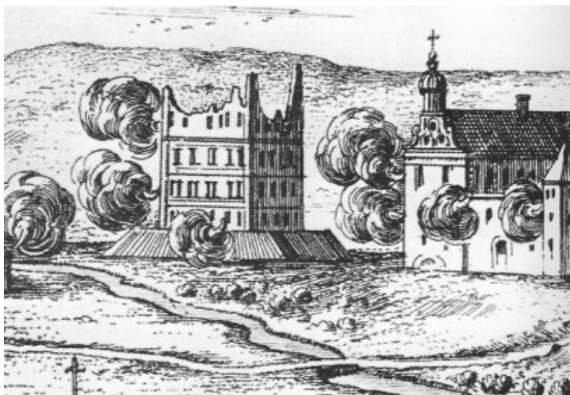
Pożar Piotrkowa 1657 r.

Dodatkowo pałac królewski posadowiony został na niewielkim, prawdopodobnie sztucznym, wzniesieniu, co widać na rycinie Pufendorfa, przedstawiającej pożar Piotrkowa podczas tzw. Potopu.