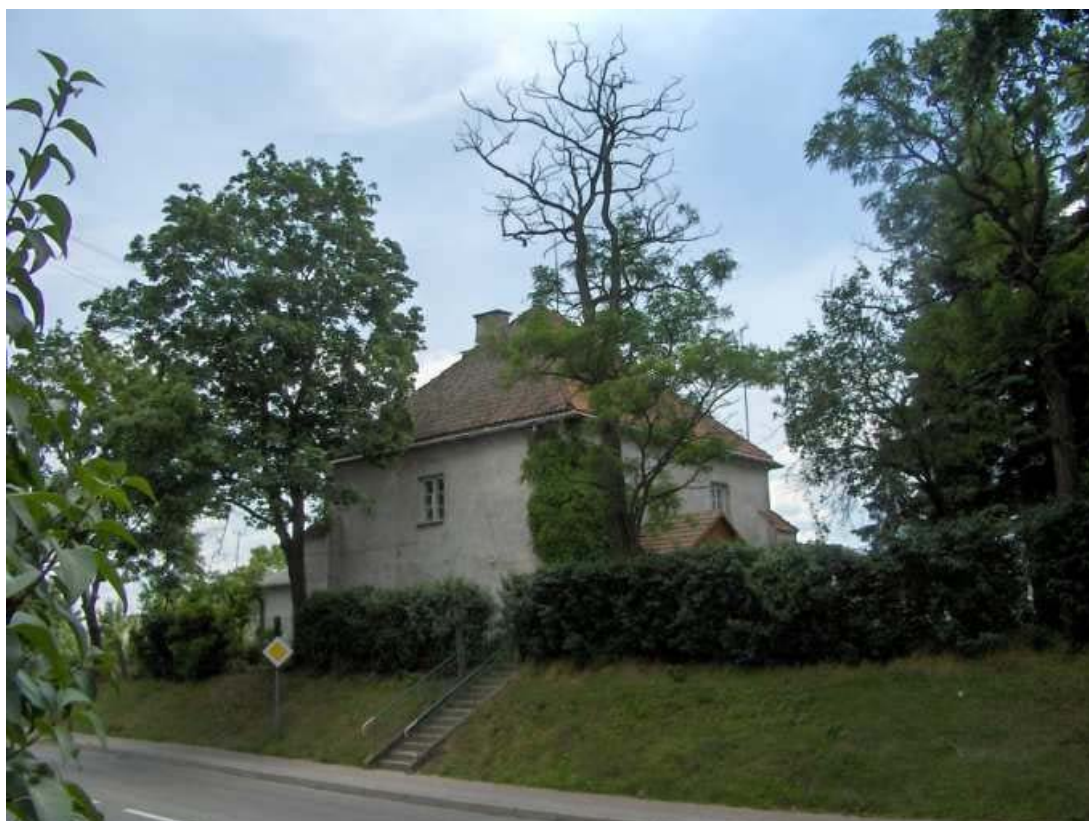
Kamienica w Końskowoli jest posadowiona na wyraźnym, sztucznym wyniesieniu

Kamienica w Końskowoli jest kopią piotrkowskiej również i w tym elemencie – do dziś zauważalne jest wyniesienie, prawdopodobnie usypane na obwodzie dawnego wału obronnego.