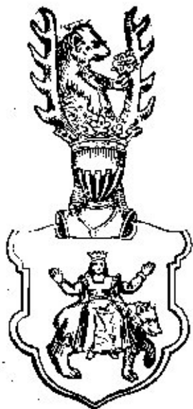
Herb Rawa wg herbarza Bartosza Paprockiego.

sprzymierzeńcem Władysława Łokietka w jego drodze odbudowy Królestwa po okresie rozbicia dzielnicowego. Chociaż pierwszy urząd uzyskał z rąk Wacława II z czeskiego rodu Przemyślidów, który podbił Małopolskę w 1291 r., to już około 1305 r. przyłączył się do Łokietka, walnie wspomagając go w odzyskaniu przez niego ziemi sandomierskiej.