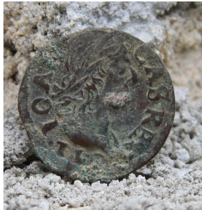
Odnalezione w kościele monety z czasów króla Jana Kazimierza pozwolą na datowanie tzw. tylmanowskiej przebudowy świątyni