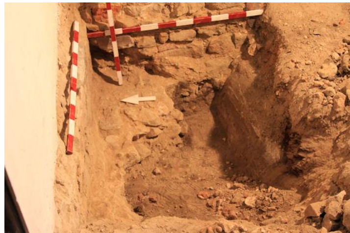
W trakcie realizacji projektu odkryto w prezbiterium relikty XV wiekowej murowanej świątyni