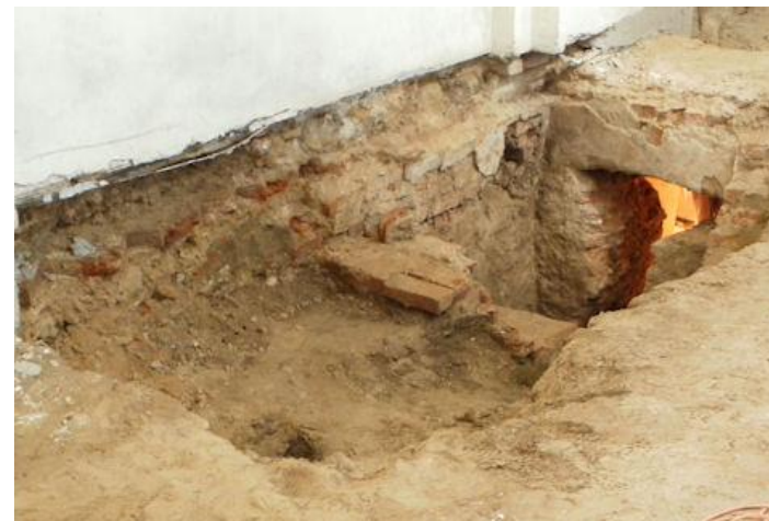
Projekt przewiduje odtworzenie pierwotnego wejścia do krypty północnej (Opalińskich)