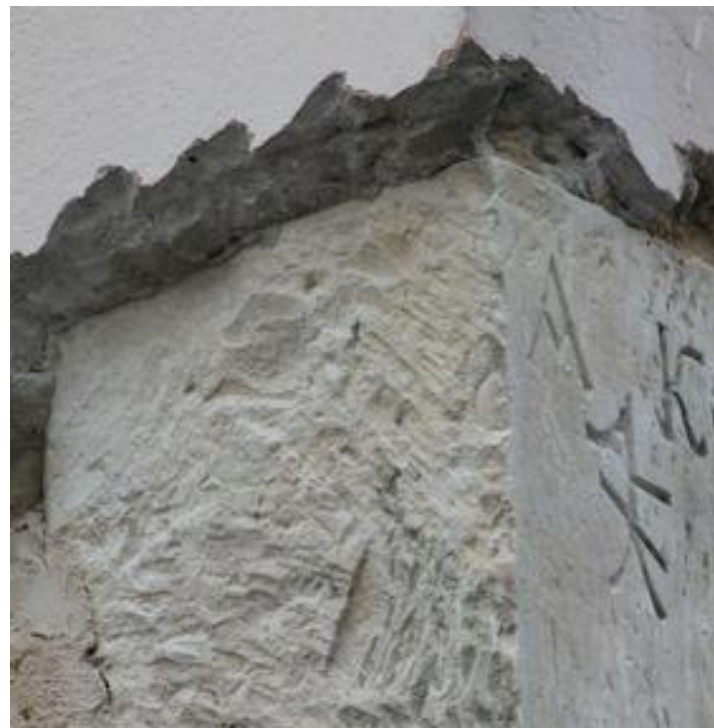
Średniowieczny znak kamieniarza na murze zakrystii, odnaleziony w trakcie realizacji projektu