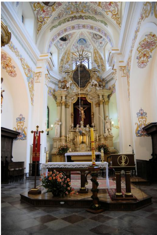
Prezbiterium przed rozpoczęciem projektu (powyżej) oraz po zmianie posadzki (fotografia poniżej)